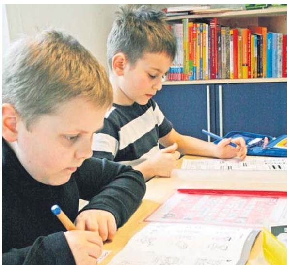
Nach der Schule in den Nachmittagstreff – neben der Erledigung der Hausaufgaben stehen Spiel und Entspannung auf dem Programm.

„Der Brose Kids Club ist ein Juwel in der Krone der Bildungs- und Betreuungslandschaft unserer Stadt.“