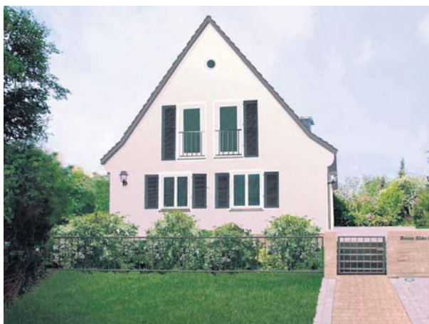
Der Brose Kids Club am Hinteren Glockenberg 36 – umgeben von einem großen Garten mit Spielgeräten und kleinem Schwimmbecken.