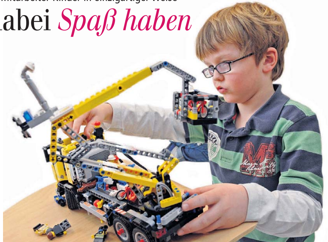
Früh übt sich, was ein richtiger Techniker werden will – im Brose Kids Club gibt's dazu jede Menge Gelegenheit.