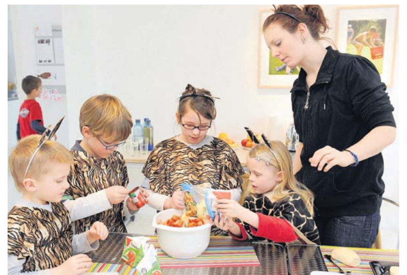
Selber kochen macht einfach mehr Spaß – bei der Dschungelparty während der Faschingsferien helfen alle kräftig mit.